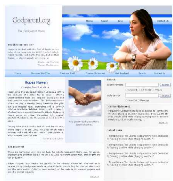
Ejemplos de portales creados con Servi Portal